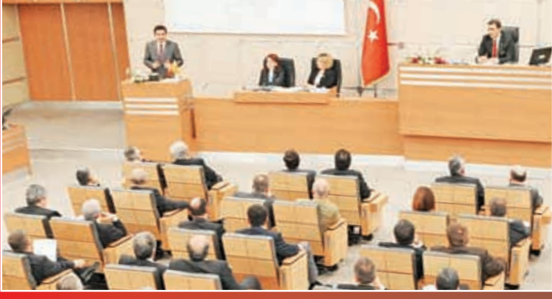
İTO Meclisi, seçimler sonrası ilk olağan toplantısını 12 Mart'ta yaptı.